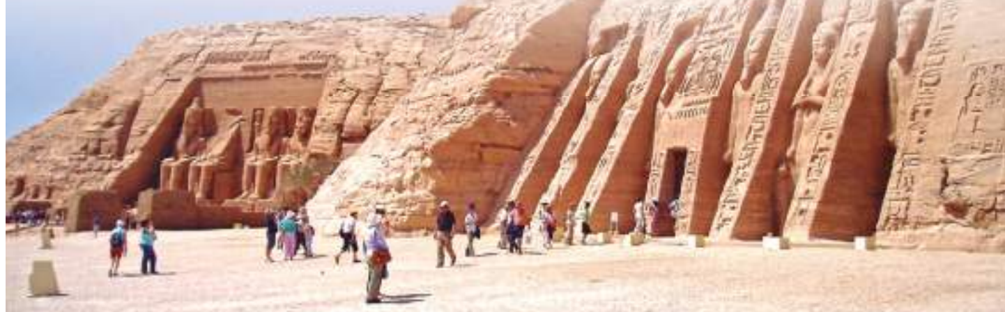
ABU SIMBEL - EGIPTO