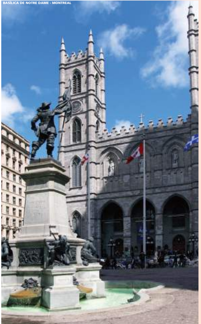
BÁSILICA DE NOTRE DAME - MONTREAL

A la hora conveniente, traslado al aeropuerto.