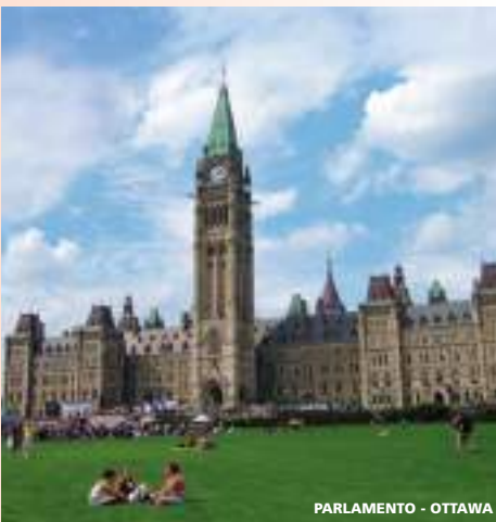
PARLAMENTO - OTTAWA