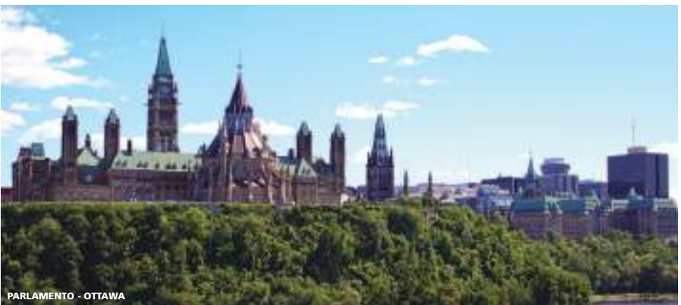
PARLAMENTO - OTTAWA

15 días (14 noches de hotel) desde 3.185 USD