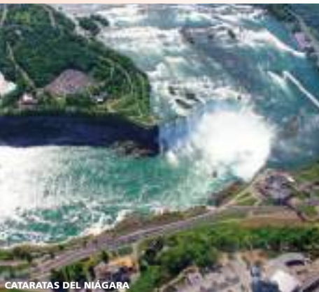
CATARATAS DEL NIÁGARA